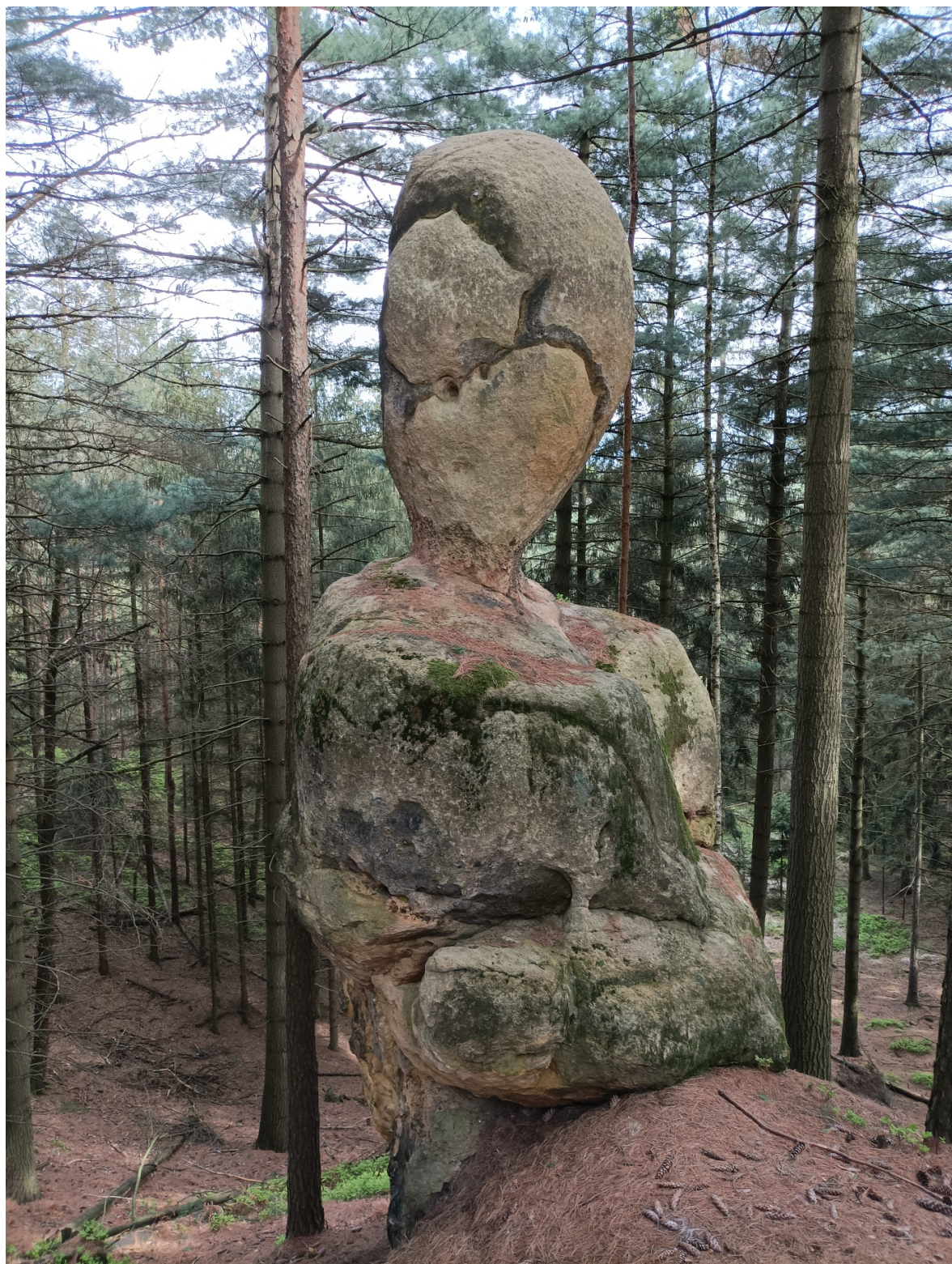
Obrázek č. 1/6