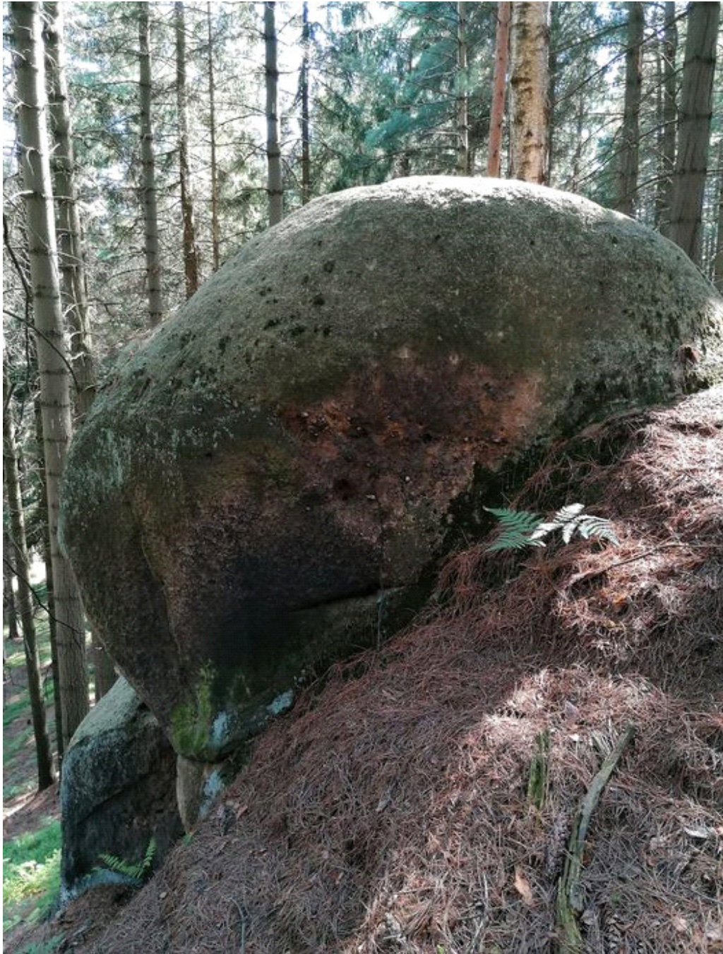
Obrázek č. 1/3