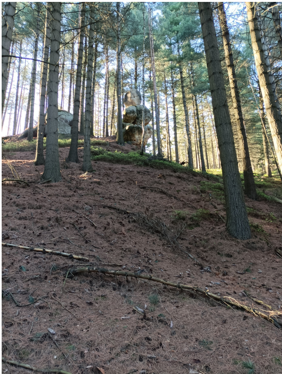
Obrázek č. 1/8

Širší okolí sochy (pohled směrem západním)