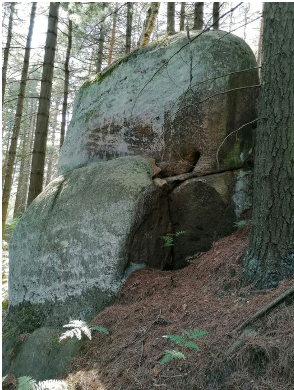
Obrázek č. 1/4