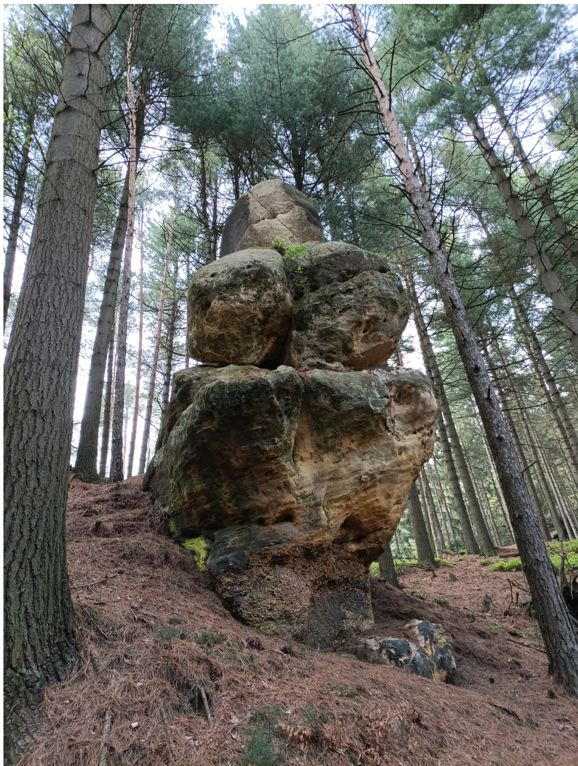
Obrázek č. 1/4

Na hlavě, prsech, bocích a naznačených končetinách jsou vytesané tváře.