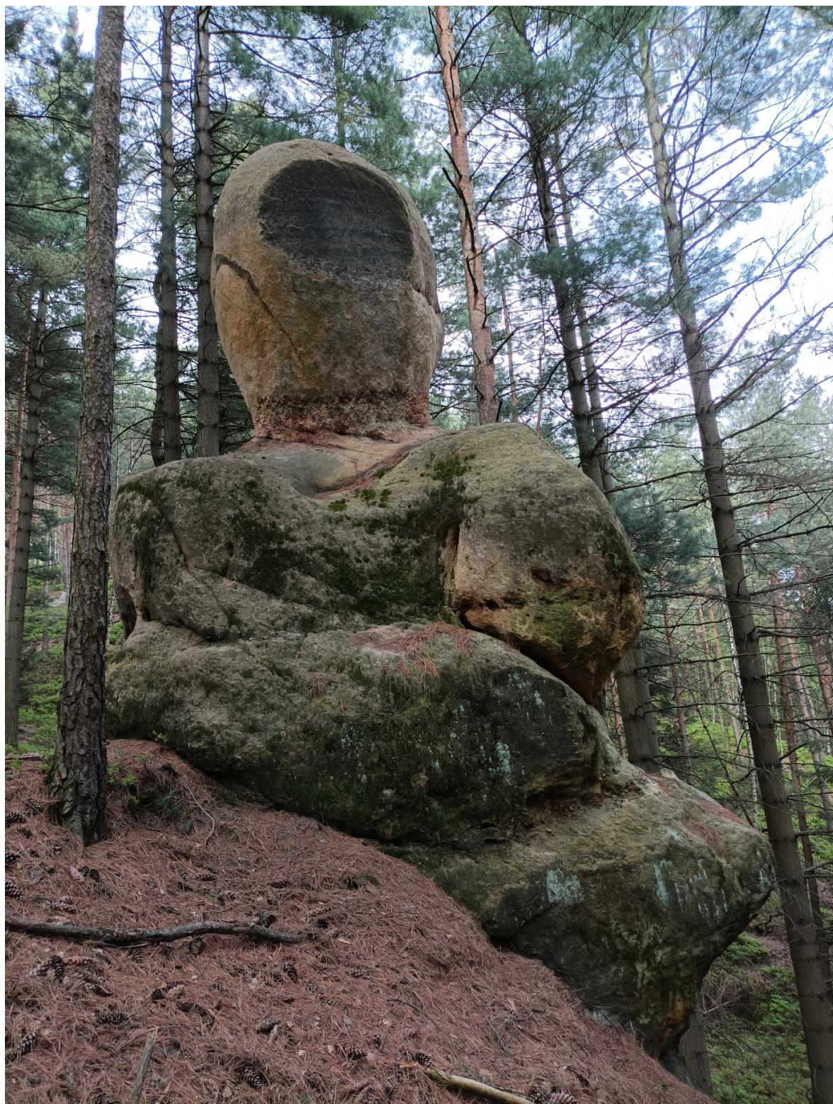
Obrázek č. 1/5

Odtesaná severní část hlavy oválu s tváří a hvězdou ve tvaru vločky. Pod ním je další tvář se zuby.