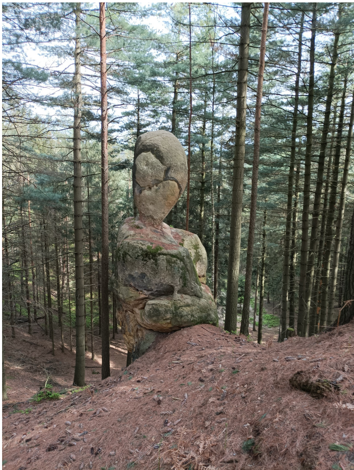
Obrázek č. 1/7