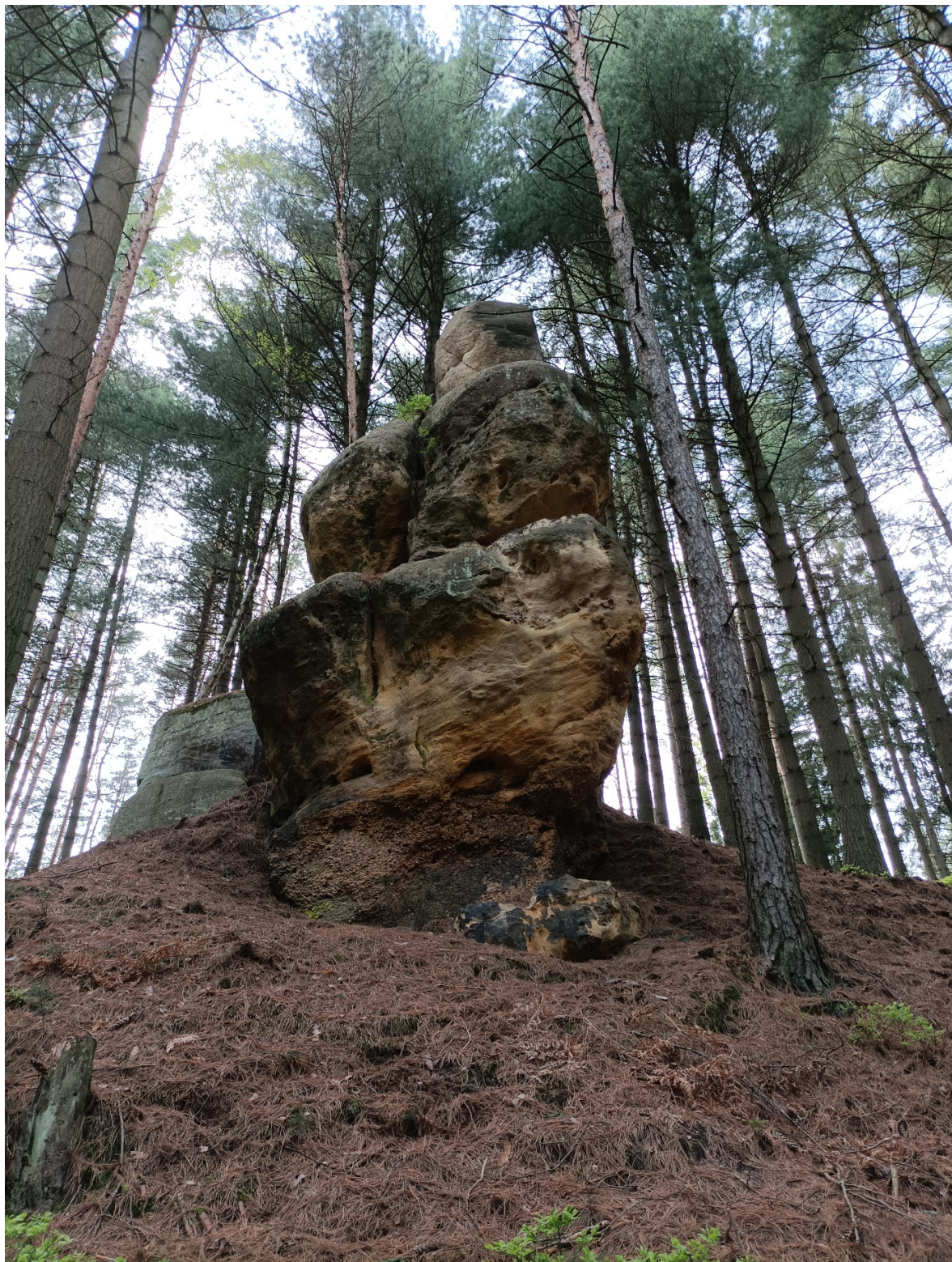
Obrázek č. 1/3